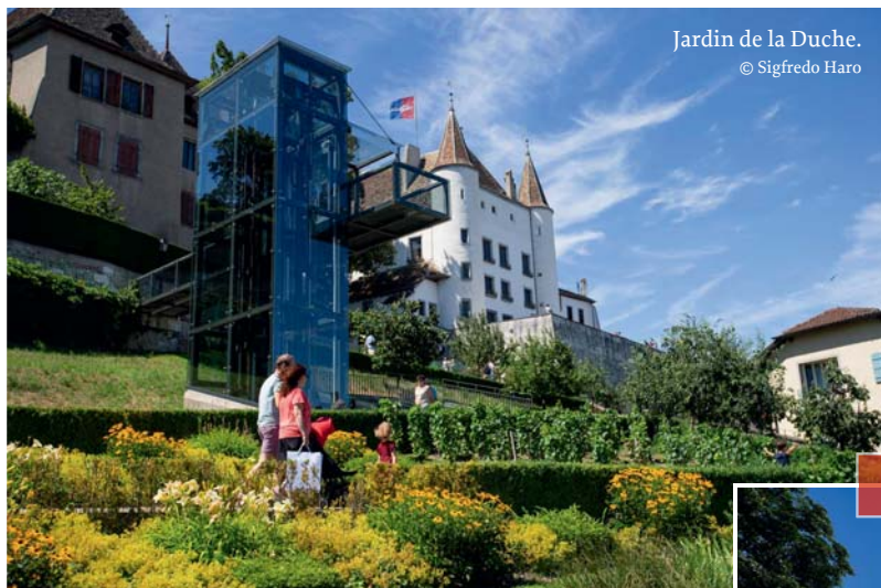
Jardin de la Duche.