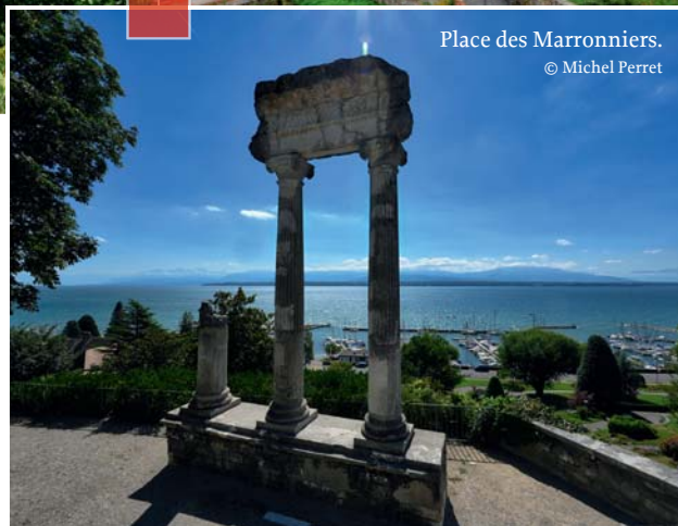
Place des Marronniers.