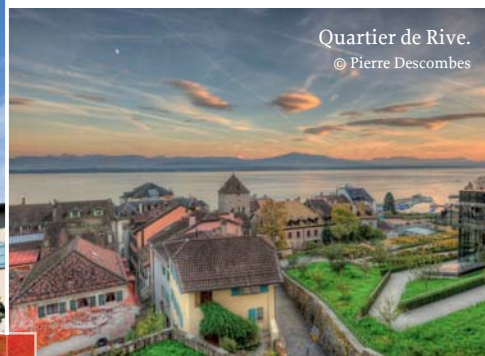
Quartier de Rive.