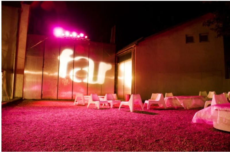
far°, les arts vivants à l'honneur.

de notes manouches, blues, soul ou pop dans une atmosphère détendue et lumineuse. Le festival met également un point d'honneur à offrir une scène aux jeunes talents régionaux, souvent révélés lors de jam sessions qui prolongent les soirées.