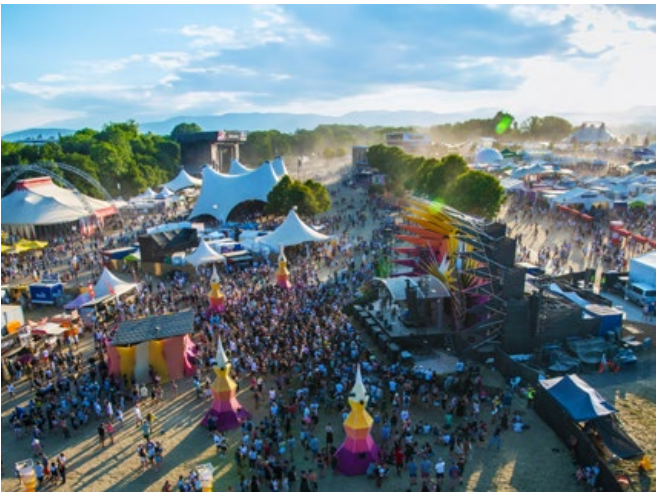
Le Paléo Festival, six jours d'énergie et de musique à ciel ouvert.

y vient autant pour écouter des têtes d'affiche internationales que pour découvrir de jeunes talents suisses, autant pour vivre un spectacle de cirque contemporain que pour déguster un plat venu d'Asie ou d'Afrique. Le festival s'est aussi positionné comme pionnier en matière de durabilité: