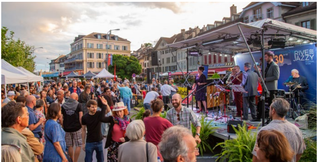
Concerts en bord de lac et soirées à ciel ouvert lors de Rive Jazzy.

L'été venu, les mélodies se font plus douces avec Rive Jazzy, dont les concerts prennent place sur les terrasses du bord du lac. Durant cinq semaines, Nyon se remplit