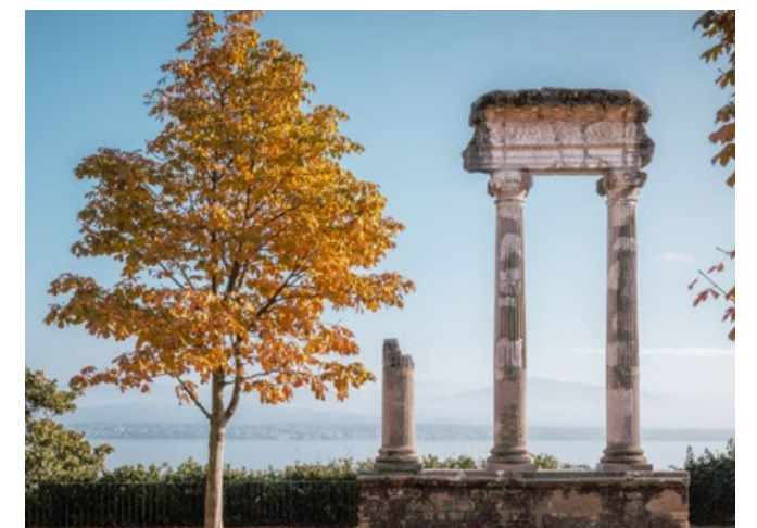
Les colonnes romaines, témoins intemporels de Noviodunum.

des expositions temporaires, mettant en lumière l'ampleur et la sophistication de la cité gallo-romaine.