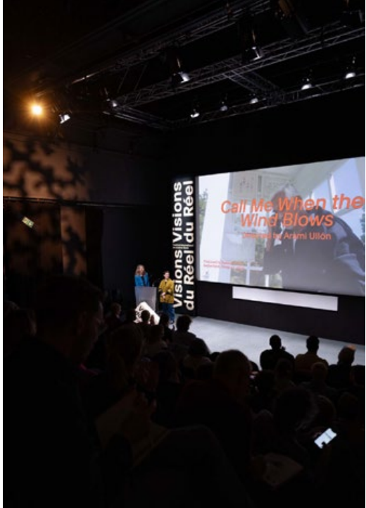
Visions du Réel, dix jours de films au cœur de Nyon.