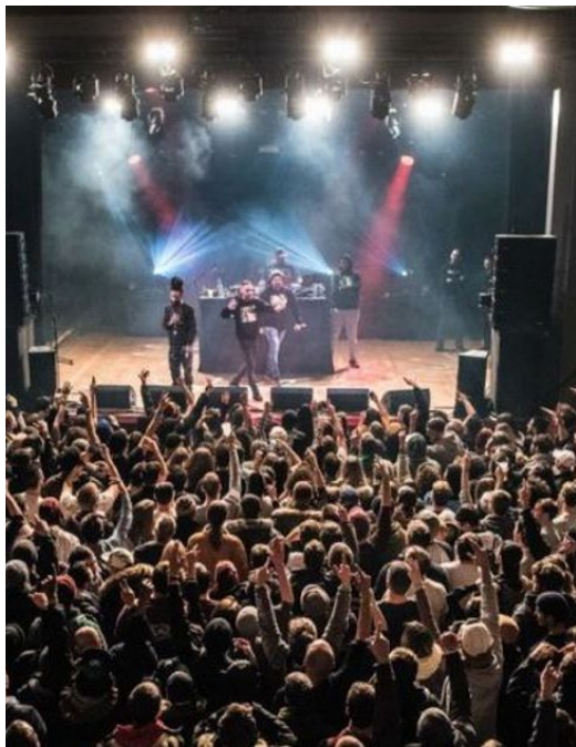
Les Hivernales, une scène qui réchauffe l'hiver nyonnais.

Lorsque les températures baissent, Les Hivernales ouvrent la saison culturelle. Ce festival urbain a su imposer son identité : concerts intimistes ou explosifs disséminés dans différents lieux de la ville, ambiance chaleureuse au cœur de l'hiver et programmation éclectique allant du reggae au rap en passant par le hardcore, pour rassembler toutes les générations sous un même souffle musical.