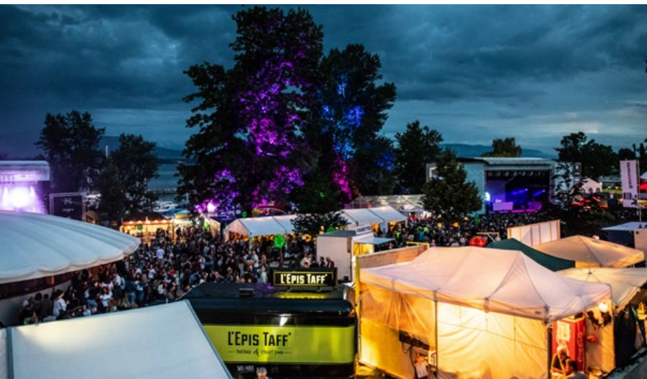
Au Caribana, le plus petit des grands festivals, la programmation est éclectique.

Organisé presque entièrement par des bénévoles, le festival se distingue par ce mélange touchant de professionnalisme et d'esprit associatif. On y vient pour la musique, bien sûr, mais aussi pour ce cadre idyllique qui invite à la fête tout en restant à taille humaine. En marge des concerts, le Caribana soigne son hospitalité : espaces lounge, terrasses au bord de l'eau, ponctués parfois d'expériences culinaires qui ajoutent à l'élégance du lieu. Une parenthèse lumineuse au début de l'été.