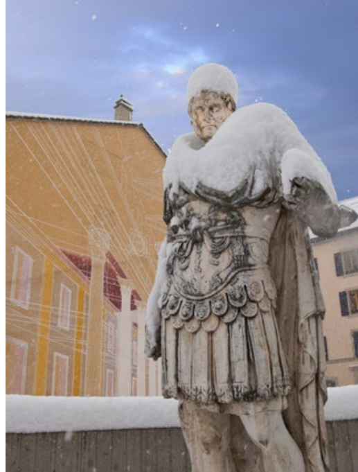
Jules César veille sur le Musée romain.

Dans le centre historique, Nyon dévoile d'autres trésors : la Colonne romaine, dressée au milieu de façades plus récentes, ou encore la charmante Tour de l'Horloge qui domine les toits. Les ruelles pavées, les passages étroits et les placettes fleuries composent un décor où chaque pierre raconte un fragment d'histoire.