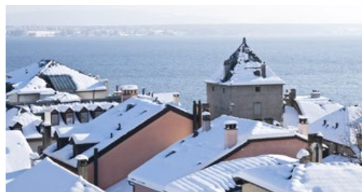
La vieille ville de Nyon parée de blanc.

Partenariat éditorial avec la Ville de Nyon