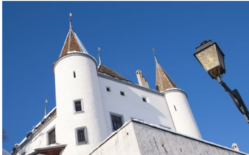
Le Château de Nyon sous la neige, majesté hivernale.