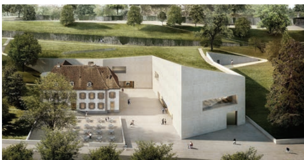
Projet d'extension du Musée du Léman.

Cinq domaines d'actions constituaient le programme de législature autour de sept objectifs généraux. Concernant le développement du centre-ville, la mise