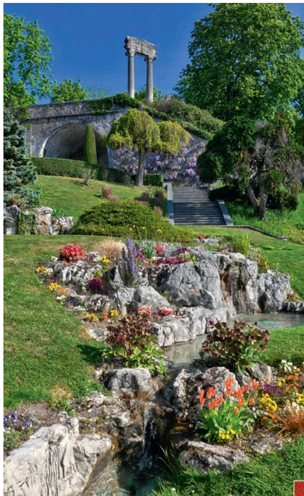
Nyon s'engage pour favoriser la nature et la biodiversité dans toute la ville. Photo: le parc du Bourg-de-Rive.