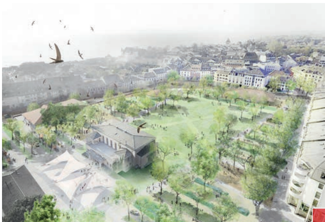
Projet de parc Perdtemps avec, à gauche, au premier plan, la Salle communale, et à droite la future médiathèque-bibliothèque-ludothèque.