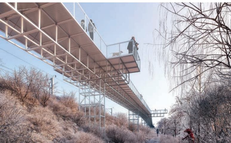
Projets de passerelles de Bois-Bougy et Nyon-Prangins pour rendre le centre-ville plus accessible. © Explorations Architecture